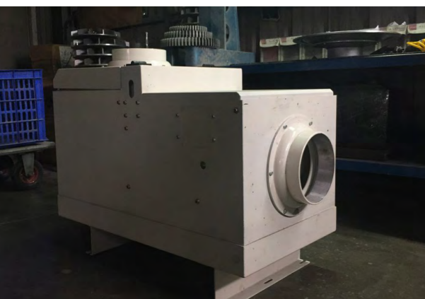
圖 1. 產品成果照 (1)

本計畫產品為有別於傳統風機與進氣口直線式氣流道組合，以橫置式設計降低油霧顆粒直接碰撞風扇扇葉的凝集成油垢機率；並應用流體力學原理促使氣流產生加速與增壓，將油霧氣甩入過濾槽，提高油霧粒子凝集碰撞次數而增加淨化效率；再經由四層過濾集收裝置，包括不銹鋼網、不織布網、活性炭網與超細玻纖網，凝集微細油霧與氣味，使排出乾淨的氣流。